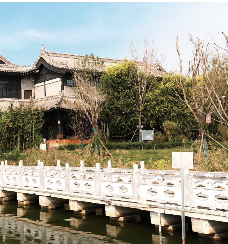
蜿蜒的汉白玉亲水栈道