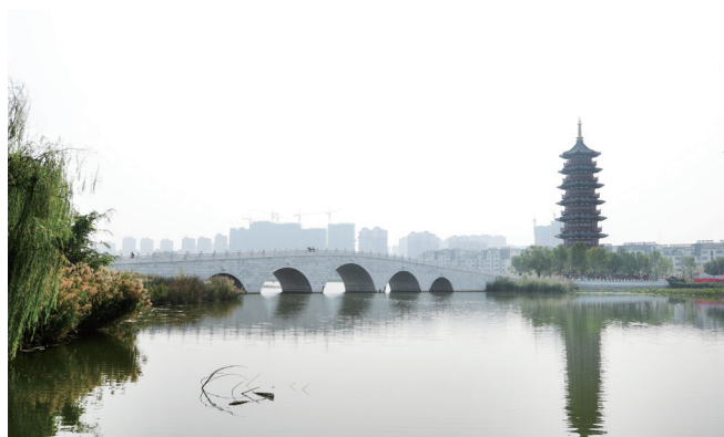
长桥卧波与古塔相映成趣