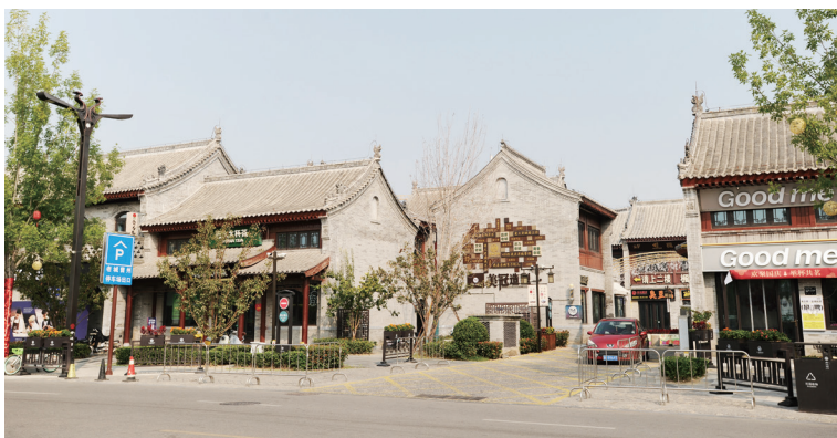
繁华的商业街一角