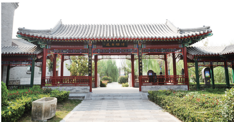
美丽大方的凉亭游廊