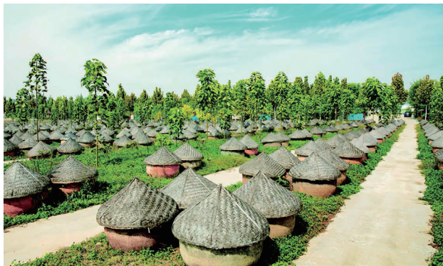
伯乐酱菜文化产业园的林下酱缸

成武是著名的天然酱菜之乡，在九女这方沃土上，酱菜制作工艺得以传承和创新，2020 年 5 月，伯乐酱菜文化产业园参与全市乡村振兴重大项目观摩。