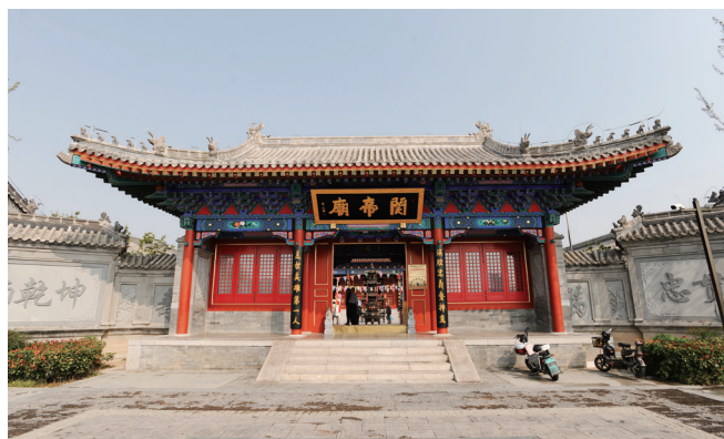
忠义彰显的关帝庙