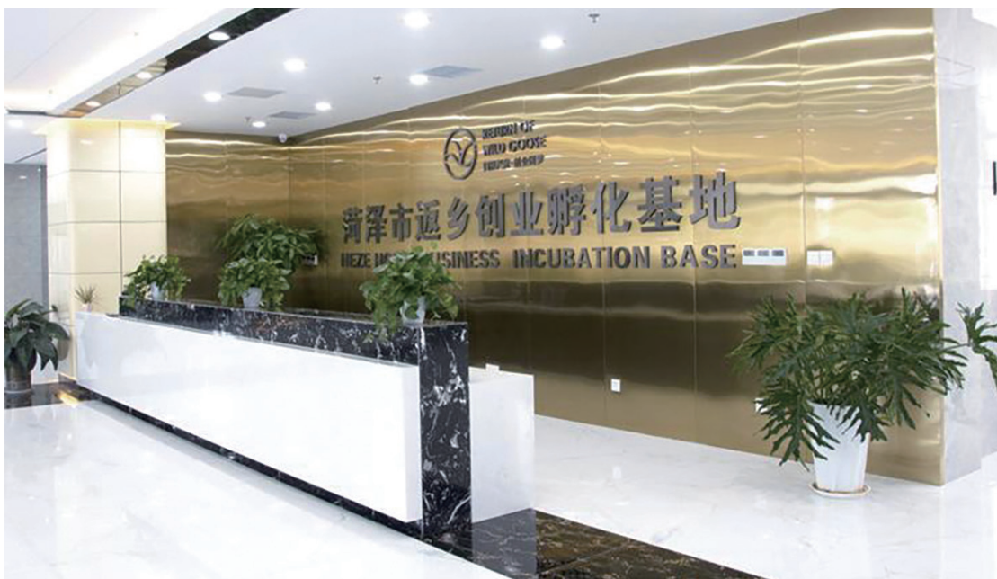
菏泽市返乡创业孵化基地

习近平总书记指出，要鼓励外出能人返乡创业，为乡村振兴提供人才保障。近年来，菏泽市立足人力资源丰富、在外人员数量多的特色实际，坚持系统观念、集成思维，创新实施“归雁兴菏”返乡创业行动，通过建强服务网络、出台优惠政策、搭建创业平台、实施典型引领等机制，累计推动返乡创业就业 52.1 万人，探索出一条返乡创业促乡村振兴新路径。全国返乡入乡创业就业现场会在菏泽召开，“归雁兴菏”行动荣获“第五届全球最佳减贫案例”，菏泽市返乡创业服务中心被国务院表彰为“全国农民工工作先进集体”。