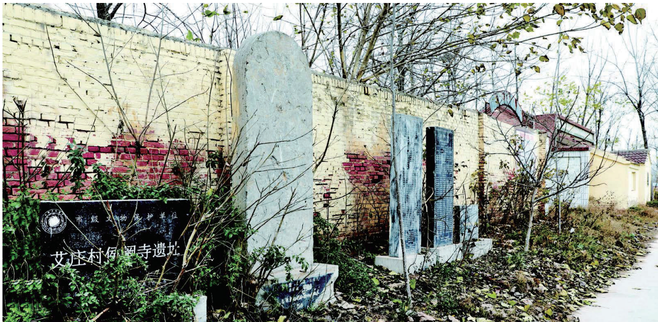
艾庄村侯阌寺遗址