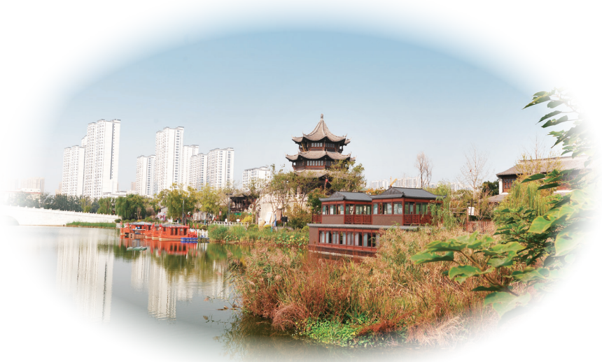
碧波荡漾的游船码头

菏泽新建仿古城是一次成功的文化实践，它让古老的历史在现代社会中焕发出新的生机与活力。随着项目的不断完善与发展，相信这座仿古城将成为菏泽乃至全国文旅版图上的一颗璀璨明珠，吸引着更多人前来探寻它的魅力，感受菏泽深厚的文化底蕴。