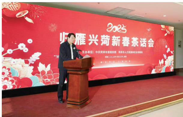
2025 归雁兴菏新春茶话会

一是建立常态化评优机制。全领域、多维度开展返乡创业创新典型评选活动，对获奖者奖励 2 万-5 万元，153 人获评“市长创业奖”“归雁之星”，30 多家服务站获评“优秀返乡创业服务站”，63 家返乡创业企业获评“菏泽市返乡创业示范企业”。二是实施制度化政治激励。全力支持优秀返乡人才参选村支部书记、党代表、人大代表、政协委员，实现政治上受尊重、精神上有荣誉、社会上有地位。1596 名返乡创业人员进入“两委”班子，其中担任村党支部书记 304 人。三是开展长效化典型推介。择优推荐优秀返乡创业典型参加国家、省创业荣誉评选，11 人荣获“全国优秀农民工”称号；6 人荣获山东省“十大返乡创业农民工”称号，2 人在第六届山东省返乡创业农民工大赛中获奖，数量居全省前列。